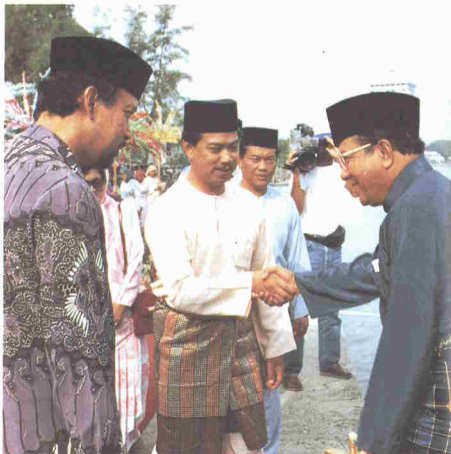
Tan Sri Haji Muhyiddin bersalaman dengan Tun Syed Ahmad Sahabuddin sambil diperhatikan oleh Tan Sri Haji Abdul Rahim.