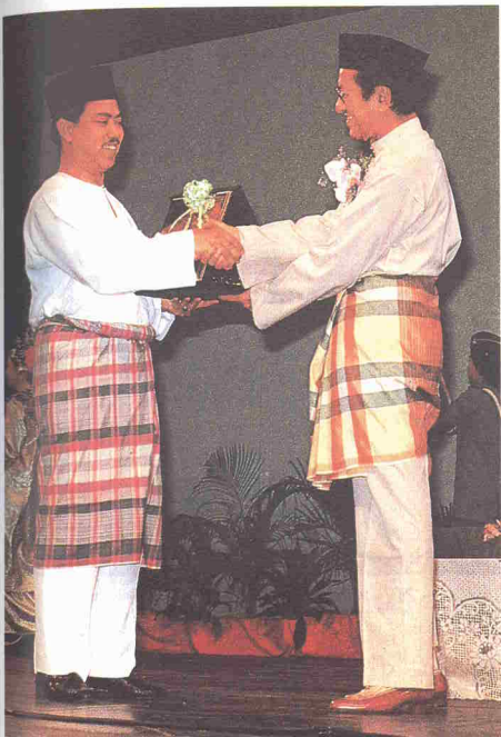
Tan Sri Haji Muhyiddin sedang menerima 'shield' Anugerah Kualiti Perdana Menteri 1990 daripada Dato Seri Dr. Mahathir.