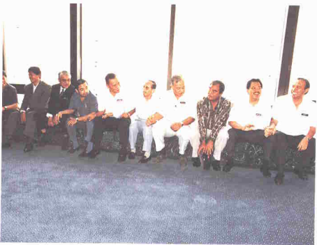
Tan Sri Haji Muhyiddin bersama rakan-rakan sejawatannya.