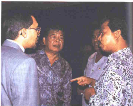
Calon Timbalan Presiden Dato' Seri Anwar dan Calon Naib Presiden, Tan Sri Haji Muhyiddin sedang berbicara sesuatu sambil diperhatikan oleh Dato' Mohamed Rahmat.