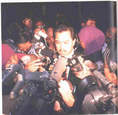
Tan Sri Haji Muhyiddin sebagai tokoh yang paling hampir dengan insiden Istana Bukit Serene sentiasa mendapat perhatian pihak media massa.