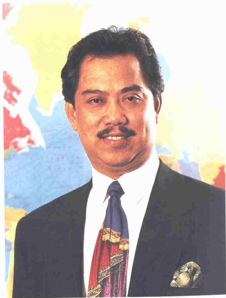
Tan Sri Haji Muhyiddin sering jadi mangsa keadaan, tetapi matang dalam mengharungi cabaran.