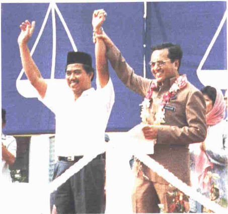
Tan Sri Haji Muhyiddin bersama Dato Dr. Mahathir pada satu majlis perjumpaan selepas menang tanpa bertanding bagi kerusi DUN Bukit Serampang.