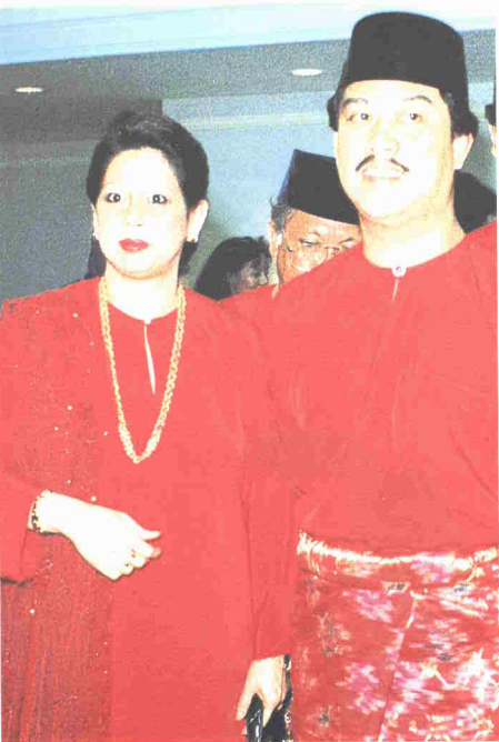
Pasangan bahagia Tan Sri Haji Muhyiddin dan Puan Sri Norainee.