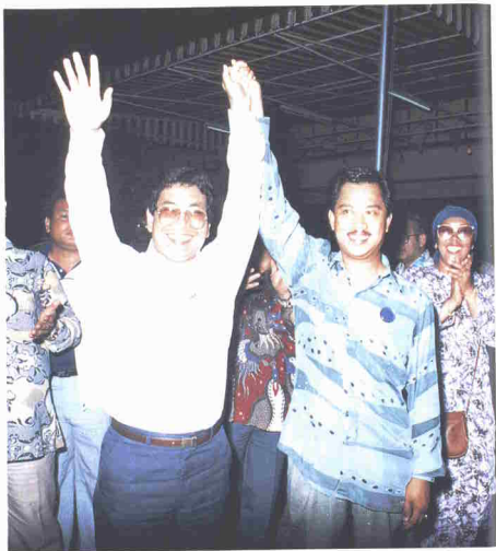
Kemenangan Barisan Nasional pada Pilihanraya Kecil Parit Raja berjaya membersihkan imej kepemimpinan di peringkat pusat dan negeri.