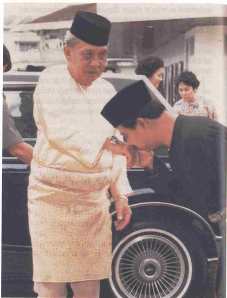
Krisis Perlembagaan ditangani oleh Tan Sri Haji Muhyiddin dengan penuh sopan.