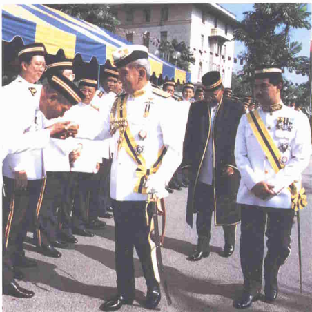
Tan Sri Haji Muhyiddin mengiringi Sultan Johor sempena perasmian Pembukaan Persidangan Dewan Undangan Negeri Johor.