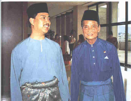
Tan Sri Haji Muhyiddin bersama Tun Datu Mustafa.