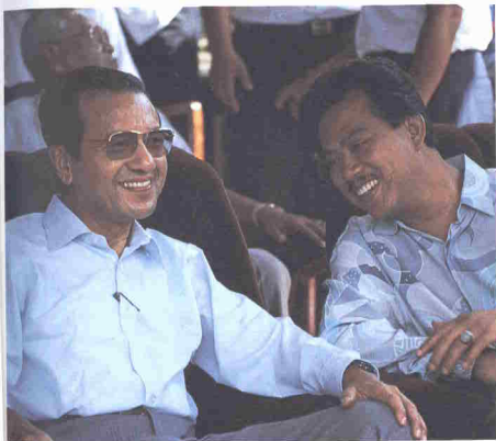
Tan Sri Haji Muhyiddin dan Dato Seri Dr. Mahathir pada satu perjumpaan bersama rakyat di Sri Gading.