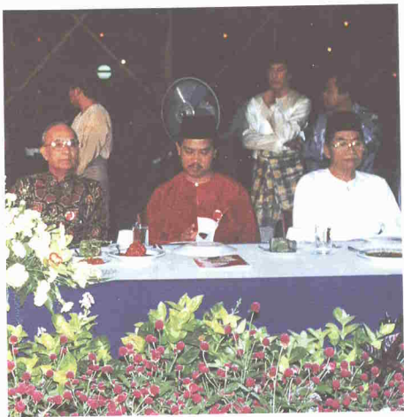
Tenaga penggerak di sebalik Perhimpunan Melayu Johor.