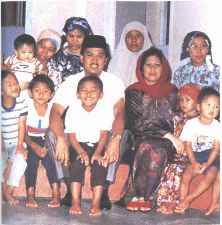
Tan Sri Haji Muhyiddin bernesra bersama anak-anak yatim.