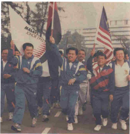
Berlari bersama rakyat sempena Larian Antarabangsa Johor 1992.