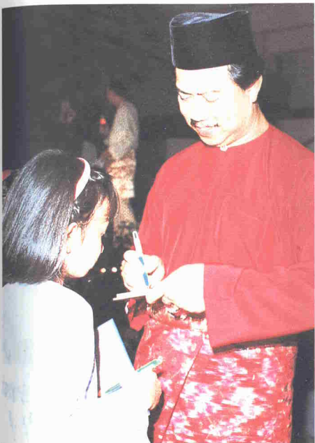
Tan Sri Haji Muhyiddin senang bergaul dengan sesiapa sahaja termasuk kanak-kanak.