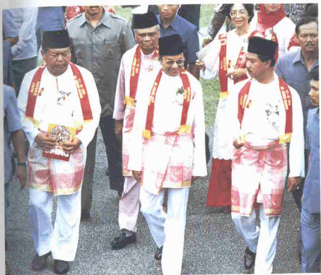
Raptai Raksaksa di perkarangan Istana Besar sempena sambutan kelahiran UMNO.