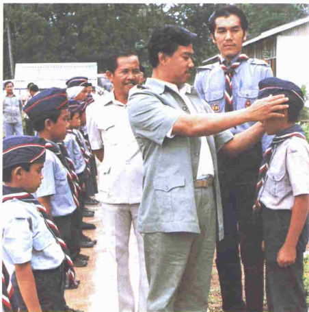
Soal disiplin menjadi keutamaan Tan Sri Haji Muhyiddin ke arah melahirkan generasi yang berwawasan.