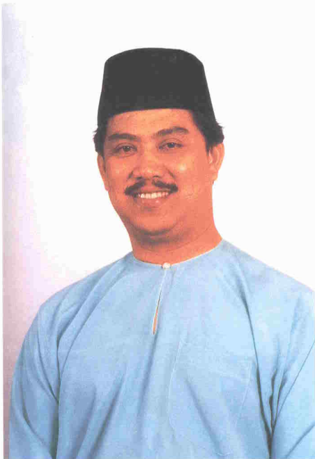
Tan Sri Haji Muhyiddin disifatkan oleh ramai temannya sebagai anak Tok Guru yang berjurus.