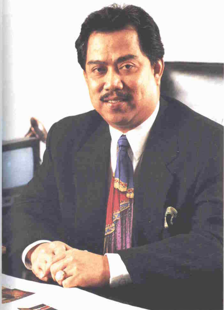
Tan Sri Haji Muhyiddin sentiasa bertindak cemerlang dalam menyelesaikan pelbagai kemelut yang melanda kepemimpinannya.