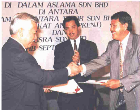
PKENJ sentiasa menerokai pelbagai peluang pelaburan termasuk usahasama dengan sektor swasta.