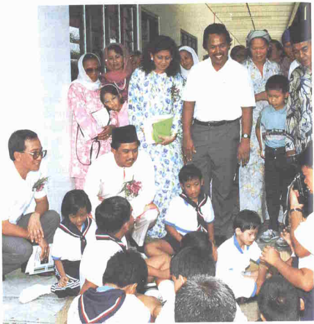
Tan Sri Haji Muhyiddin sedang bermesra dengan kanak-kanak.