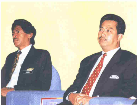
Tan Sri Haji Muhyiddin bersama rakan sejawatannya Tan Sri Ramli Ngah Talib.