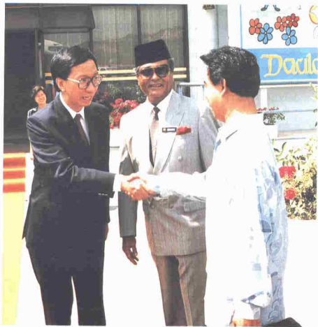
Dr. Koh Tsu Koon, Tan Sri Osman Aroff dan Tan Sri Haji Muhyiddin.