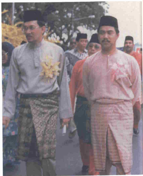
Tan Sri Haji Muhyiddin bersama Dato ' Seri Anwar Ibrahim.