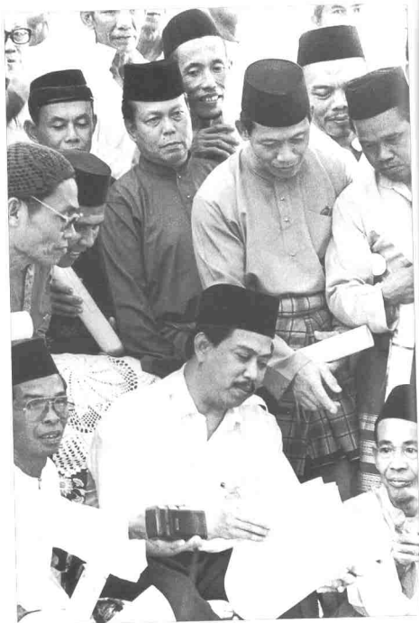
Simbol keakraban antara rakyat dengan pemimpin.